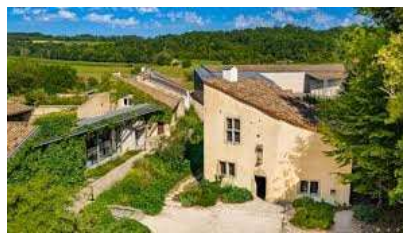
Maison natale de Jeanne d'Arc

270 m - 85 habitants. Patrie de Jeanne d'Arc. Sa maison natale est classée monument historique.