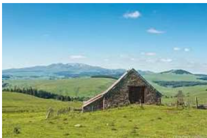
Le plateau du Cézalier

807 m - 52 habitants. La commune fait partie de la petite région agricole dénommée « Cézalier ».