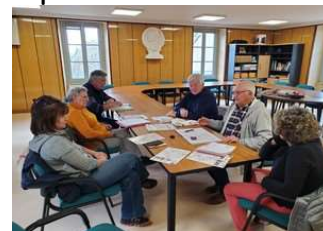
Réunion préparatoire du 16 avril 2024

960 m - 626 habitants. Situé au pied du massif du Sancy, fort de son plan d'eau et de son patrimoine historique original, le bourg s'affirme comme étant une destination majeure du Puy de Dôme. Village dominé par la statue Notre Dame de Natzy. Eglise St Pardoux bâtie au XI e siècle. Cascades naturelles du Pont de la Pierre et de Ste Elisabeth. Personnalité : Antoine Galland ayant participé à la campagne d'Egypte aux côtés de Bonaparte.