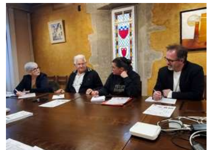
Réunion préparatoire du 16 avril 2024

460 m - 4546 habitants. Petite ville très étendue, traversée par la Loire. Eglise St Thyrese de style roman. Maison Girard construite au XVIII è et XIX è siècles, dotée d'un décor de papier peint panoramique d'une valeur exceptionnelle. Le château féodal de Rochebaron si bien mis en valeur, domine la vallée et veille sur elle depuis neuf siècles. Figurine de la Tène, découverte dans la Loire.