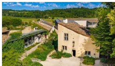
Maison natale de Jeanne d'Arc

270 m - 85 habitants. Patrie de Jeanne d'Arc. Sa maison natale est classée monument historique.