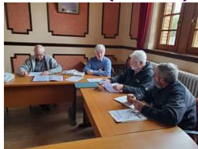
Réunion préparatoire du 9 avril 2024

130 m - 508 habitants. Village très apprécié pour son patrimoine naturel et sa douceur de vivre. Eglise St Médard du XVII e siècle. Château édifié par la famille de Joyeuse au XVI e siècle.