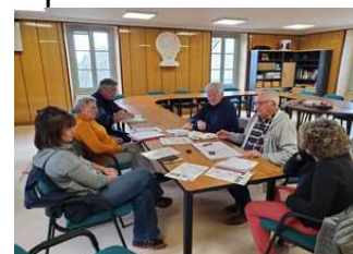
Réunion préparatoire du 16 avril 2024

960 m - 626 habitants. Situé au pied du massif du Sancy, fort de son plan d'eau et de son patrimoine historique original, le bourg s'affirme comme étant une destination majeure du Puy de Dôme. Village dominé par la statue Notre Dame de Natzy. Eglise St Pardoux bâtie au XI e siècle. Cascades naturelles du Pont de la Pierre et de Ste Elisabeth. Personnalité : Antoine Galland ayant participé à la campagne d'Egypte aux côtés de Bonaparte.