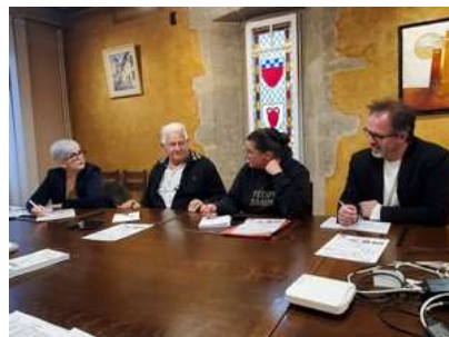
Réunion préparatoire du 16 avril 2024

460 m - 4546 habitants. Petite ville très étendue, traversée par la Loire. Eglise St Thyrese de style roman. Maison Girard construite au XVIII è et XIX è siècles, dotée d'un décor de papier peint panoramique d'une valeur exceptionnelle. Le château féodal de Rochebaron si bien mis en valeur, domine la vallée et veille sur elle depuis neuf siècles. Figurine de la Tène, découverte dans la Loire.