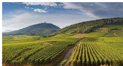
Vignoble du Vendômois

85 m - 244 habitants. Eglise St Georges du XII ème siècle, remaniée au XVI ème siècle - lambris du XVI ème siècle, clocher en pierre du XIII ème siècle avec beffroi et flèche de charpente. Polissoir dit la « Pierre-sorcière ». La commune est située dans l'aire de l'appellation d'origine protégée (AOP) pour le vin des côteaux du Vendômois.