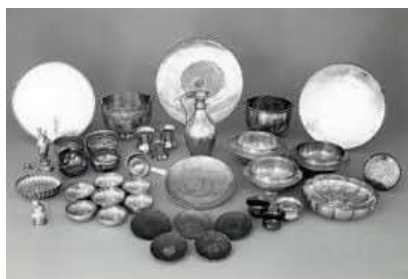
Trésor de Chaourse

110 m - 512 habitants. La commune se trouve aux portes de la Thiérache.