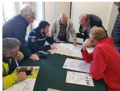
Réunion préparatoire du 18 avril 2024

162 m - 1805 habitants. Située non loin de la vallée de l'Avre, la rivière servait de frontière naturelle entre le Royaume de France et la Normandie. Eglise St Nicolas bâtie au XI e siècle au cours duquel elle est brûlée. Aux XV e et XVI e siècles, la tour actuelle remplace l'ancien clocher octogonal. Eolienne Bollée inventée par Ernest-Sylvain Bollée (1814-1891), produite en France de 1872 à 1993.