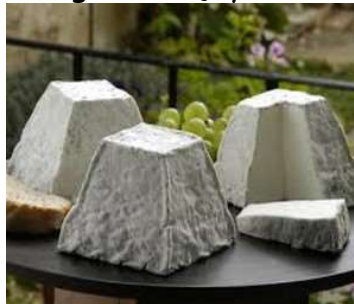
Fromage le Valençay

Village se trouvant en bordure de la forêt de Loches. Eglise St Leubais du XI e siècle avec comme particularité des lucarnes aux angles du clocher. La Pyramide des Chartreux construite au XVIII e siècle pour servir de repère de chasse. Fabrication et affinage du fromage Valençay.