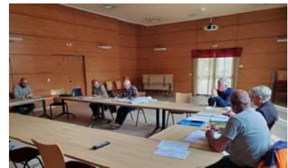
Réunion préparatoire du 15 avril 2024

255 m - 3100 habitants. La ville a la chance d'avoir trois entités paysagères sur son territoire: le massif du Grand Colombier, le fleuve Rhône et la zone protégée du Marais.