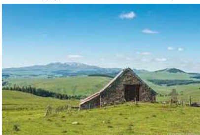
Le plateau du Cézalier

807 m - 52 habitants. La commune fait partie de la petite région agricole dénommée « Cézalier ».