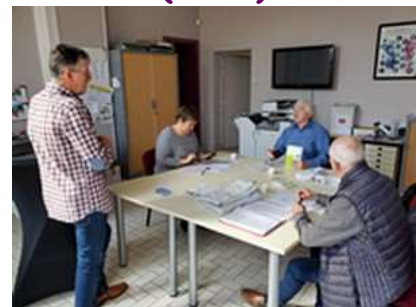
Réunion préparatoire du 8 avril 2024

124 m - 978 habitants. Eglise St Martin, romane, bâtie en 1161 par René de Guise. Salle des fêtes et de la culture inaugurée le 26 novembre 2021. Sains doit sa naissance, dit-on, à la découverte de plusieurs corps de saints. Une cave de mulquinier est datée « 1610 » (la mulquinerie est la fabrication de toiles fines ne se composant que de lin). ... Et puis, vous trouverez dans la localité une crème à tartiner sans huile, fabriquée avec du bon lait et du sucre des Hauts de France. Avis aux gourmands !