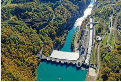
Barrage de Génissiat

Four à pain de Chaix régulièrement utilisé. Chapelle St Martin.