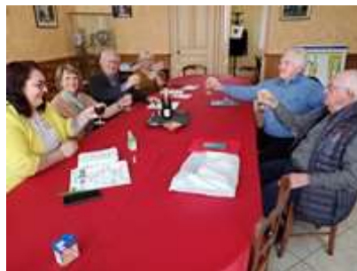
Réunion préparatoire du 8 avril 2024

61 m - 992 habitants. La commune est traversée par deux cours d'eau: le canal du Nord et l'Agache. Eglise St Aignan du XVI e siècle. En 1918 l'église est détruite à l'exception de son clocher aujourd'hui classé.