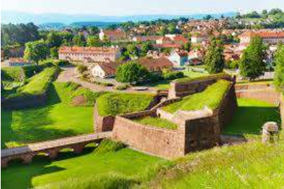
(Territoire de Belfort)

358 m - 45155 habitants. La ville est établie dans un seuil entre les Vosges et le Jura. Cathédrale St Christophe bâtie de 1727 à 1750 en grès rose. Le Lion de Belfort, œuvre du sculpteur alsacien Auguste Bartholdi construit de 1875 à 1880. La Citadelle de Vauban édiflée en 1648. La ville est animée par de grands rassemblements annuels, notamment l'Eurockéenne (festival de musique) et le festival international de musique universitaire.