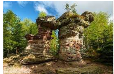
La Porte de pierre

245 m - 1448 habitants. Sur le Katzenberg subsistent des vestiges d'un mur druidique et des restes d'un château fort. Chapelle Notre Dame des douleurs datant de 1828. La Porte de pierre : curiosité géologique à 858 m d'altitude mesurant 7 m de large et 5 m de hauteur.