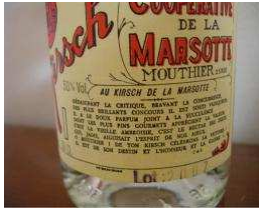
Mouthier Haute Pierre Kirsch de la Marsotte