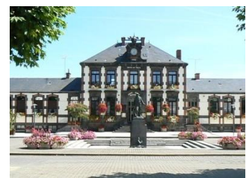
Mairie de St Eloi les Mines

Anciennes mines. Maison de la mine et du tourisme construite sur le carreau St Joseph. Chevalement du puits St Joseph. Eglise Ste Jeanne d'Arc des XIX e et XX e siècles. Eglise St Eloy du vieux bourg du XII e siècle. Plan d'eau et base nautique.