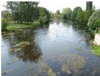
La rivière Creuse

TOURNON ST MARTIN (36) : 70 m - 1215 hab. (Tournonnais). Ruines du château de Prinçay du 15è s. Eglise St Martin du 19è s. Mado Robin, chanteuse lyrique, fréquentait régulièrement Tournon St Martin.