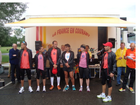
Equipe Back Europ - Mizuno