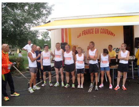
Courir pour le département de l'Eure