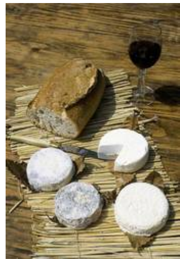
Chabichou et autres fromages de chèvre des Deux-Sèvres

Trois églises romanes : St Hilaire, St Pierre et St Savinien. Hôtel de Ménoc ou Evêché. Mine d'argent des rois francs exploitées du 7 e au 10 e s. Aujourd'hui, sur environ 30 Km de galeries, 350 m se visitent.