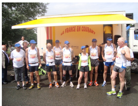
Courir pour la vie, courir pour Curie