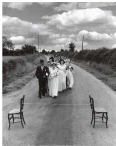
Le ruban de la mariée de Doisneau

Le photographe Robert Doisneau séjourna ici à plusieurs reprises.