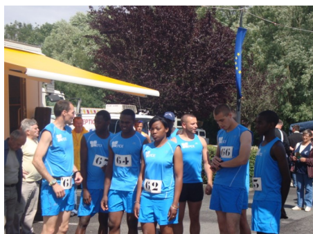
Equipe de l'EPIDE