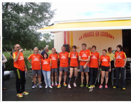
Equipe Riou Glass