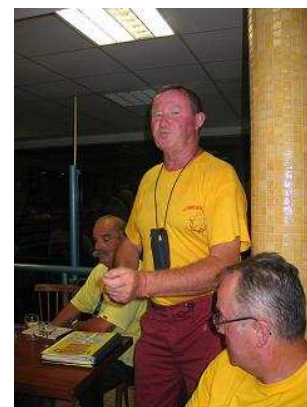
L'équipe animation du podium

Comité d'Organisation de LA FRANCE EN COURANT 7, Résidence Epervier 27300 - MENNEVAL Tél. 02 32 43 35 97 www.lafranceencourant.org