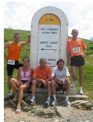
Le Maine et Loire au col de l'Aubisque (1709 m)