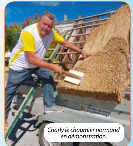
Charly le chaumier normand en démonstration.