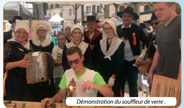
Démonstration du souffleur de verre.