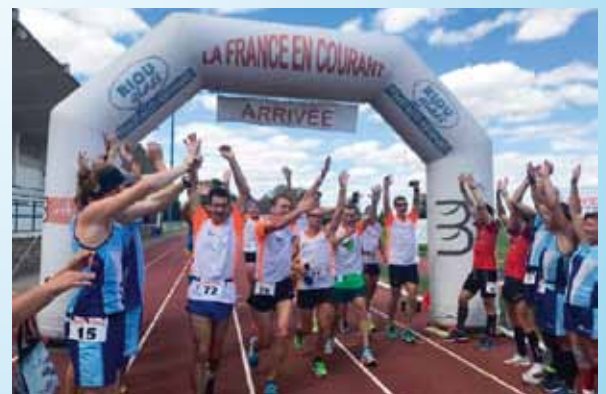
Arrivée dans la joie à Bernay et sous les applaudissements.