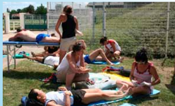
Aux étapes et demi-étapes l'équipe médicale soigne les participants.

La demi-étape permet aux coureurs de se reposer, de se doucher et recevoir éventuellement des soins