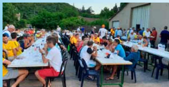
Le village de Fondamente offre l'aligot à toute la FEC.

L'arrivée vers 17 h se déroule sur le « village » de la FEC dans une joyeuse ambiance et clôturée par la remise des prix au podium.