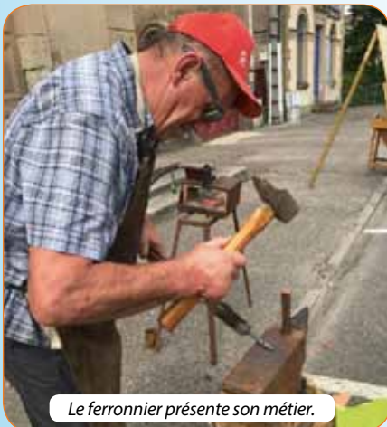
Le ferronnier présente son métier.