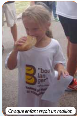
Chaque enfant reçoit un maillot.