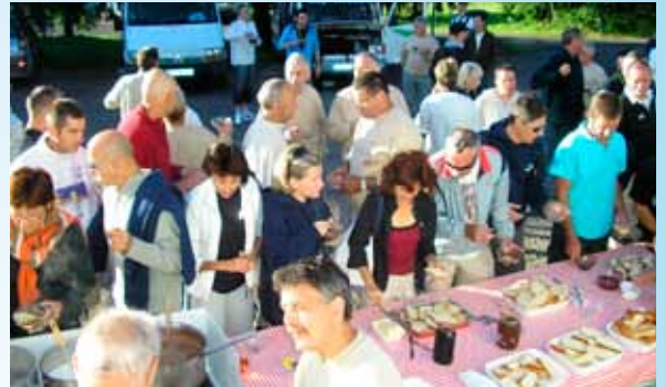
Le petit déjeuner, un grand moment de convivialité.

La 32 ème édition de la FEC avec pour thème « les plus beaux villages et détours de France » s'arrêtera dans 15 villes étape et 14 villes demi-étape et traversera 20 départements et 8 Régions !!! L'occasion de découvrir des sites prestigieux en vivant une aventure hors du commun !!!