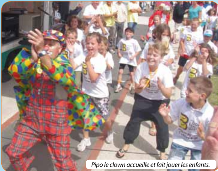
Pipo le clown accueille et fait jouer les enfants.